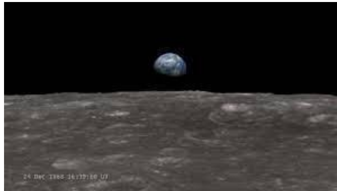
Lever de Terre de l'orbite lunaire (1968)

Et la Terre se leva, et aida les hommes pour une nouvelle ère où le bien-être règnerait. La vigilance des hommes ne serait plus désorganisée et ne nuirait plus au système cosmique. Un nouvel état du monde s'inscrirait dans le bon chemin de l'Humanité, dans le bon chemin de ce pourquoi tout cela existe. Le Big-Bang, les éléments n'ont pas été créés pour rien, il ne suffit pas d'une race, l'être humain pour tout saccager.